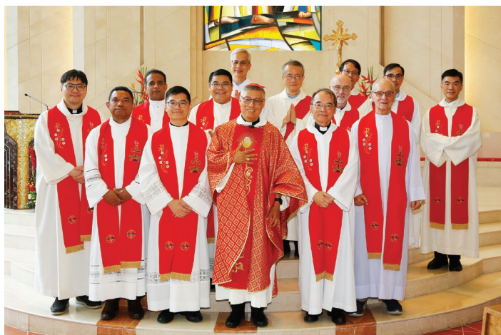
6月30日主保瞻禮彌撒