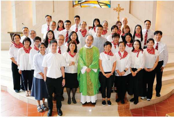
9月29日聖言宣讀員祝福禮