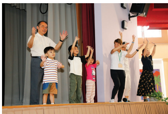
7月28日「喜樂泉源」工作坊