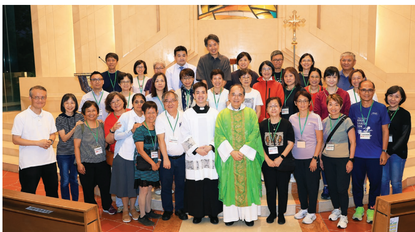
9月28日慕道班導師派遣禮