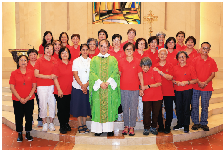
7月27日聯絡員承諾禮