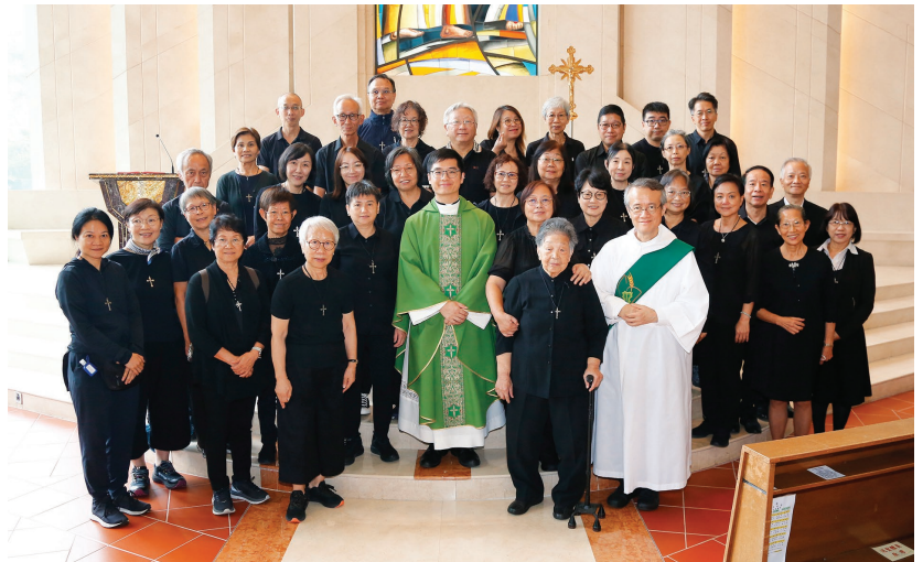
11月10日善別小組承諾禮