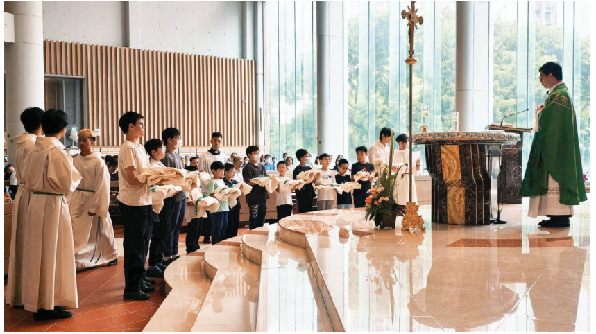
10月6日新輔祭派遣禮