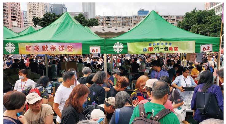
11月17日荃灣明愛賣物會