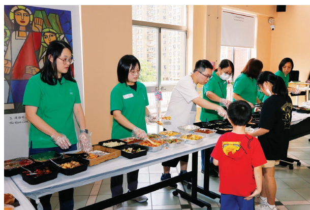
9月15日愛心飯局迎中秋