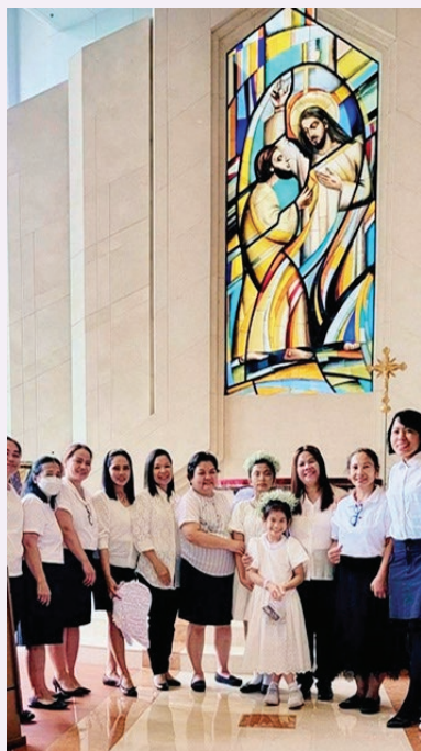
The Rosary Gathering

This is a yearly event celebrated every October, highlighting the four Mysteries of the Holy Rosary of our Blessed Mother Mary. This year, we celebrated on October 27, 2024. The celebration includes praying of the Four Mysteries of the Holy Rosary, namely Joyful, Luminous, Sorrowful and Glorious, the crowning of our Blessed Mother Mary as the Queen of Heaven and Earth, and the Marian Dance, offered to Mama Mary for her immeasurable love for us, her beloved children.