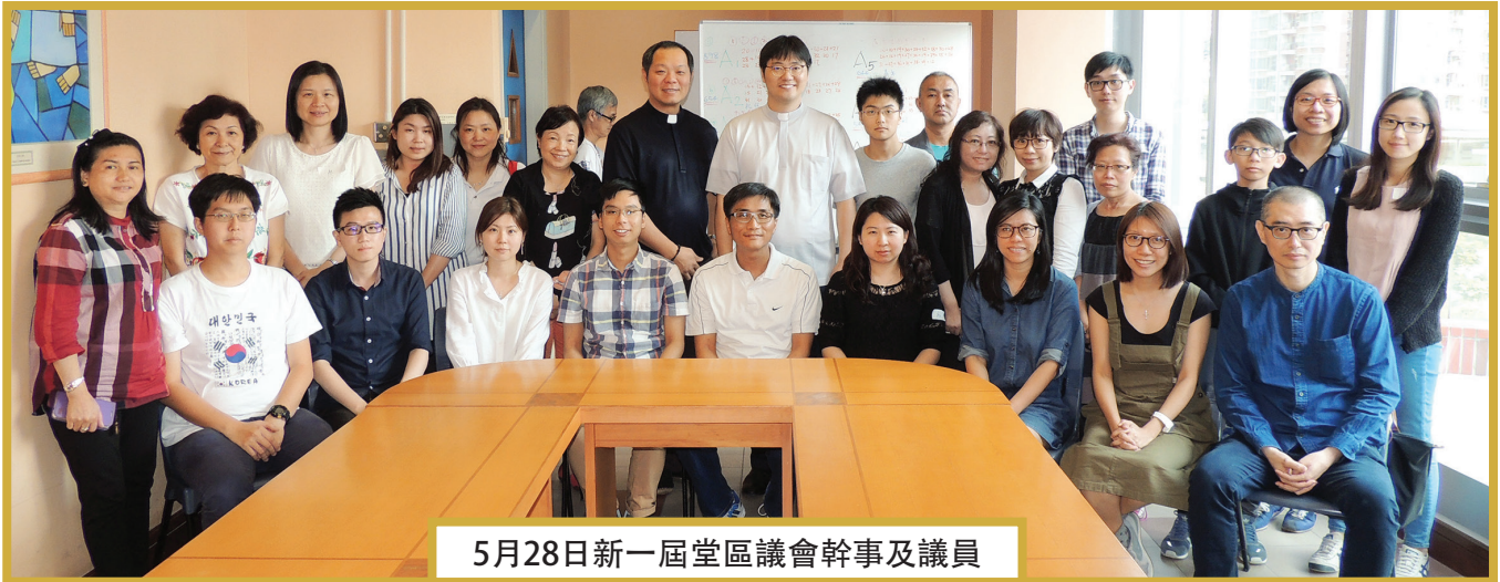
5月28日新一屆堂區議會幹事及議員