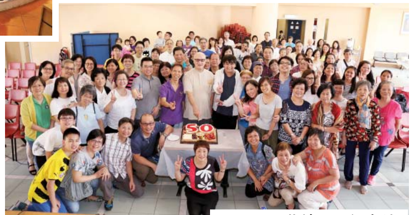
5月15日 華神父晉鐸金禧