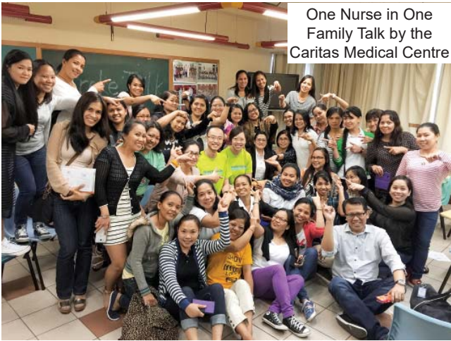
One Nurse in One Family Talk by the Caritas Medical Centre