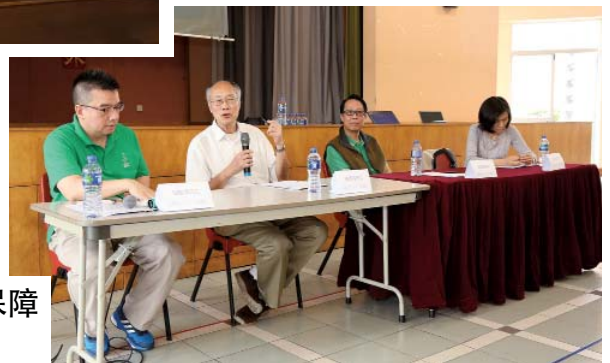
5月1日 全民退休保障 諮詢研討會