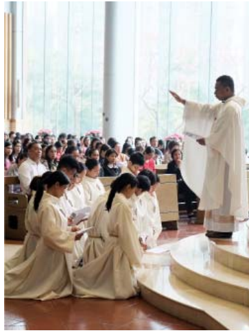
Acolytes Commissioning and Renewal of Vows