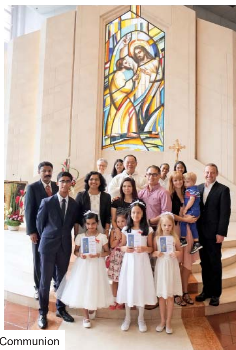
First Holy Communion