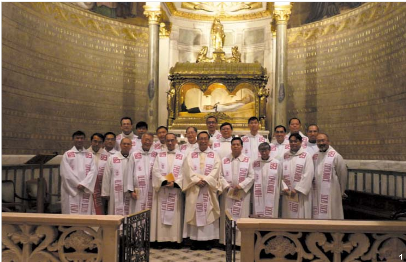
1. 朝聖團廿一位神父在主保聖維雅納司鐸的蔭庇及代禱下，矢志追隨基督。

去年6月16日於亞爾斯的本堂神父聖維雅納逝世150年紀念上，教宗隆重宣佈「司鐸年」的開始，要求全球司鐸以聖維雅納作藍本，深思反省司鐸聖召的寶貴，從而更新自我，使自己賴著主的恩寵更成為教會的善牧。如此，香港20位教區國籍司鐸在陳副主教的組織，姚崇傑神父隨團作神師指導，巴黎外方傳教會龐樂培神父的協助領導，及不少恩人的支持下，得以在本年4月27日至5月13日到法國朝聖，當中重心朝聖地就是鄉村小鎮亞爾斯。能夠總數21位神父一起離港朝聖，實是一個奇蹟及莫大的祝福，因為要21人同時放下繁重職務實非易事（而我們堂區四位神父，卻有三位參與了），但天主卻使事成了。