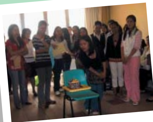
April 4, 2010 – Easter Sunday The English Community held a simple celebration for Easter Sunday simple egg hunting and birthday and anniversary celebrations of STEC.