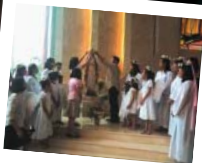
May 30, 2010 – Commemorating Marian Year May is the month of our dearly beloved Blessed Virgin Mary. A Rosary Prayer was being held before the celebration of Sunday Mass. The closing of this event took place on May 30, 2010 with the Exposition of the Blessed Sacrament and a Rosary and crowning of the Blessed Virgin Mary. Invited students from Catechism Class and selected members of STEC presented a Marian dance offering to the Blessed Virgin Mother.