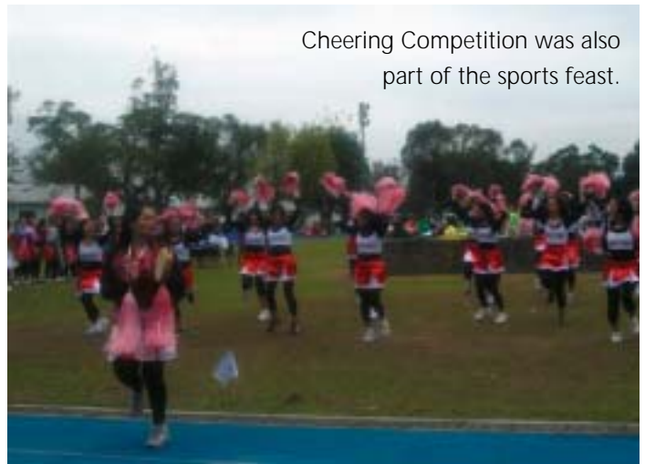
Cheering Competition was also part of the sports feast.