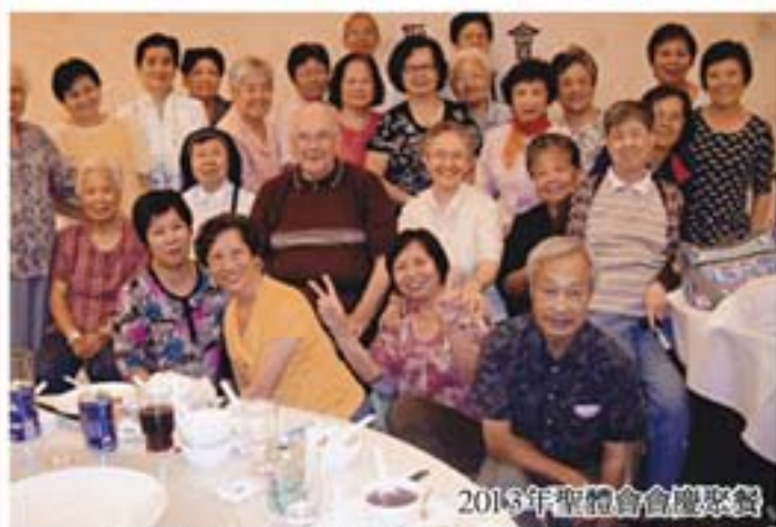
2013年聖體會會慶聚餐

首先很多謝神父給我一個機會，在這裡介紹聖體會，聖體會成立已有30多年了。聖體會是一個信仰團體，我們大家都以恭敬聖體、勤領聖體、敬主愛人、善盡本份傳揚福音為己任，及協助堂區工作，這些就是我們聖體會的宗旨。